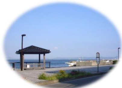
-病院の前に広がる海景色-