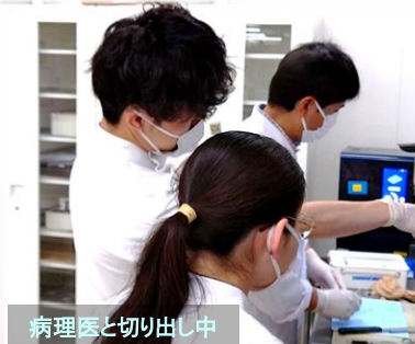
病理医と切り出し中